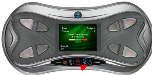
Water Care Ikon

En fargekodet linje gir et mål på systemfunksjon, Når markøren er i det grønne området er ACE systemet fullt funksjonelt. Om den skulle vises på gul eller rødt trenger systemet tilsyn.