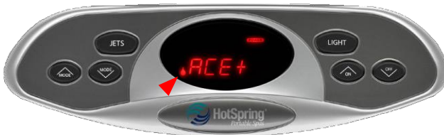
Water Care Ikon